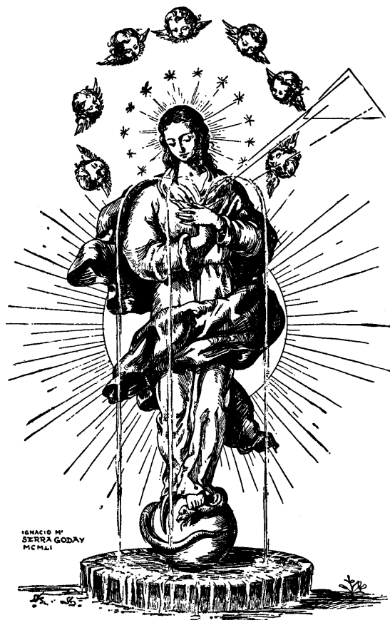
«La Virgen de Schola»